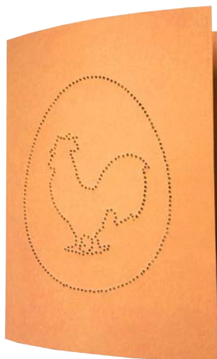
HAHN Seite 9 + 13