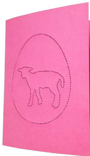
LAMM Seite 6 + 11