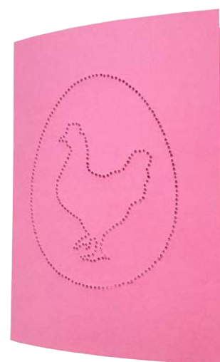
HUHN Seite 10 + 13