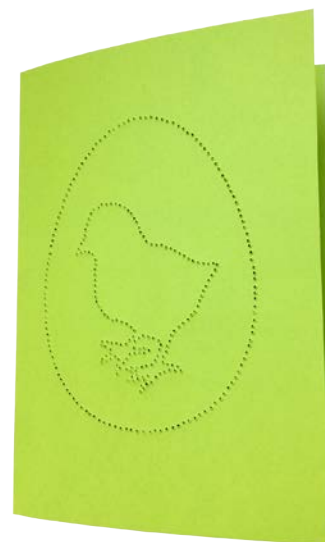
KÜKEN Seite 7 + 12