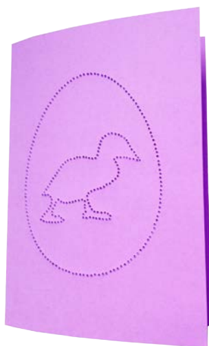
ENTE Seite 8 + 12