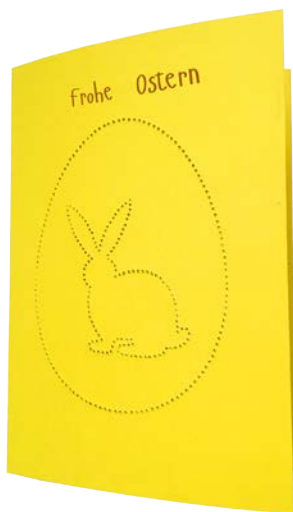
HASE Seite 5 + 11