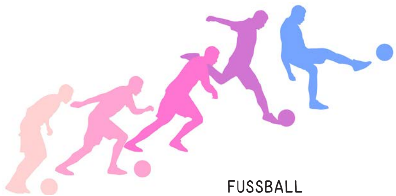
FUSSBALL Seite 20 – 24