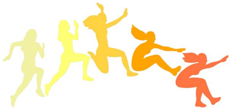
SPRINGEN Seite 10 – 14