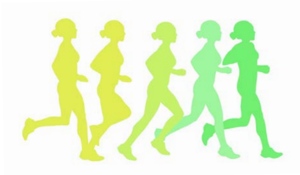
LAUFEN Seite 5 – 9