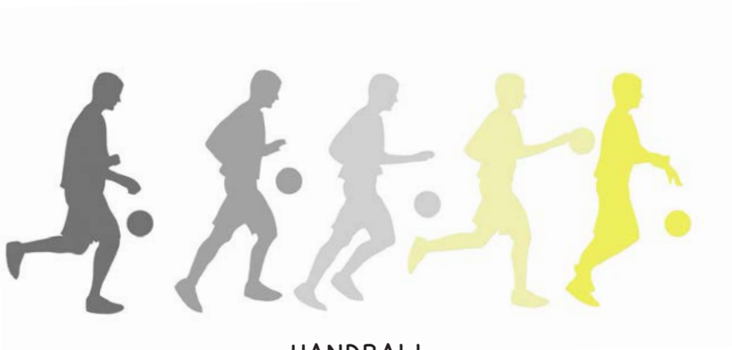
HANDBALL Seite 15 – 19