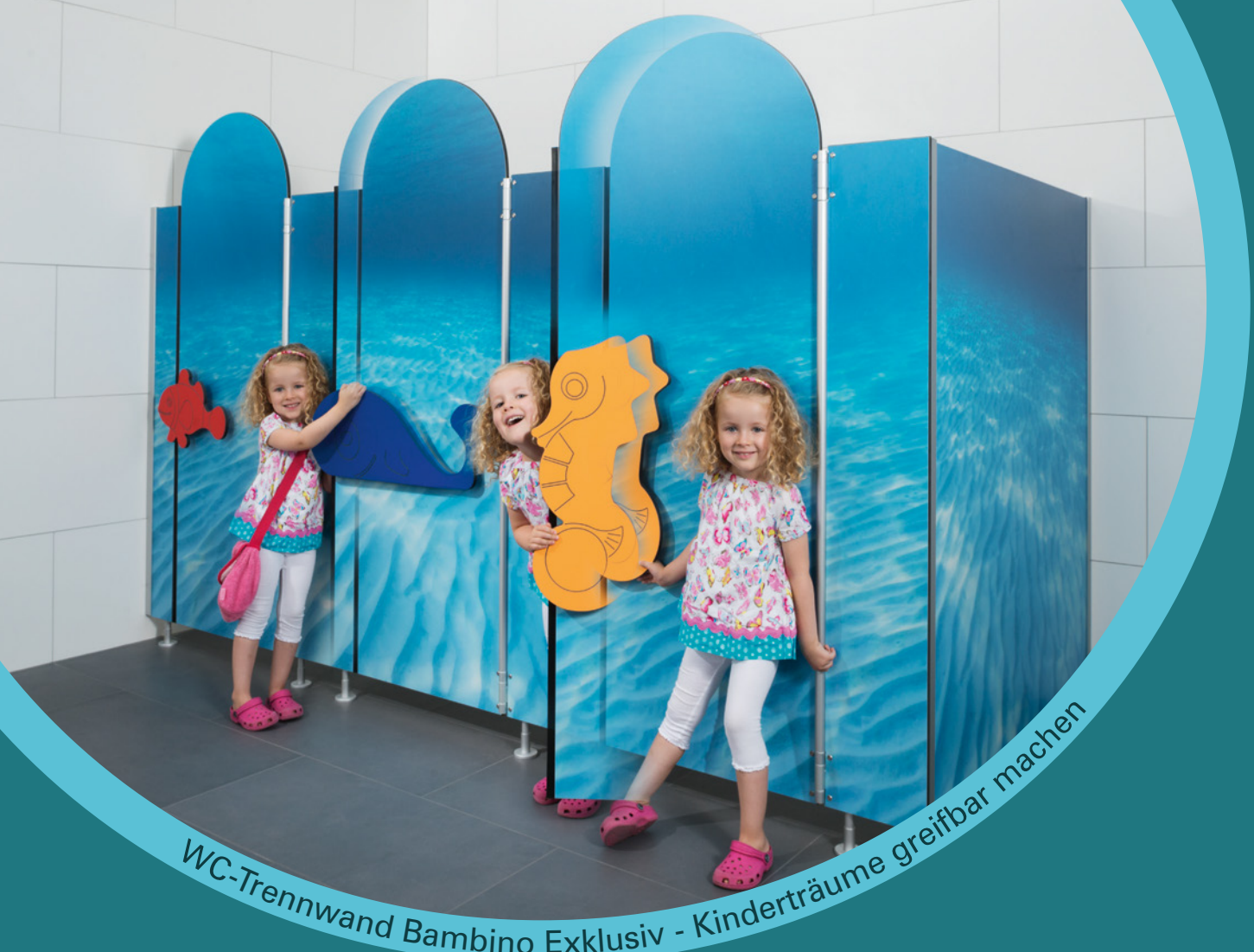
WC-Trennwand Bambino Exklusiv - Kinderträume greifbar machen