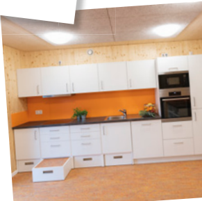
Küchen Kochen für Groß & Klein