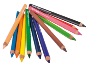
12 KuKiMa Buntstifte Dreieck , farbig sortiert P321-1007478 6,95 € inkl. MwSt