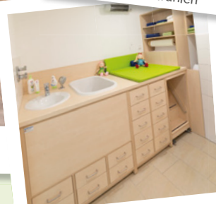
Wickelanlagen mit viel Stauraum