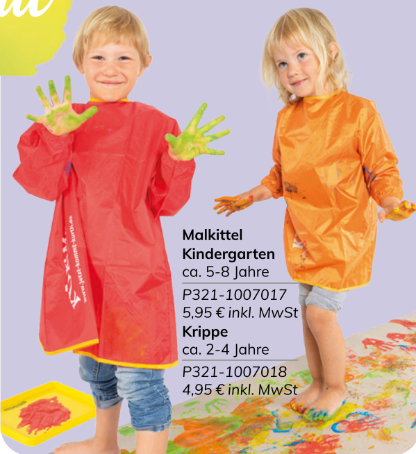
Malkittel Kindergarten ca. 5-8 Jahre P321-1007017 5,95 € inkl. MwSt Malkittel Krippe ca. 2-4 Jahre P321-1007018 4,95 € inkl. MwSt