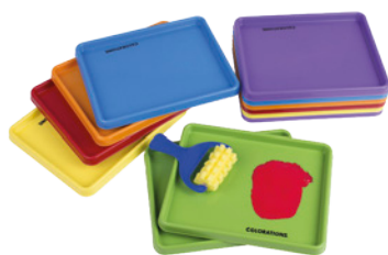
12 Kreativtablets „Multicolor“ P321-1005810 29,90 € inkl. MwSt