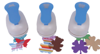
XXL-Wunderlocher Set „Natur“ P321-015693 39,95 € inkl. MwSt