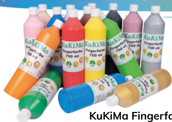
KuKiMa Fingerfarbe-Set inklusive Gold & Silber 4,91 € / 1 l P321-0174918 58,95 € inkl. MwSt