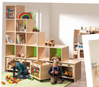
Gruppenräume funktionell für kreatives Lernen