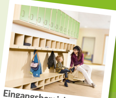
Eingangsbereiche ankommen & wohlfühlen