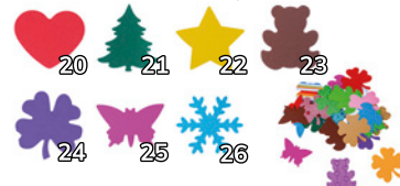
XXL-Wunderlocher Einzelmotive P321-0156-?? 13,45 € inkl. MwSt