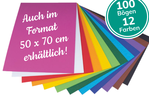
100 Bögen KuKiMa Bastelkarton , 25 x 35 cm in 12 Farben sortiert, 175 g/m 2 1,02 € / 1 m 2 P321-1021702 8,95 € inkl. MwSt