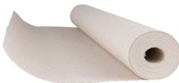
Recycling-Papierrolle „Extrabreit“ B: 65 cm, L: 18 m 0,85 € / 1 m 2 P321-1005886 9,95 € inkl. MwSt