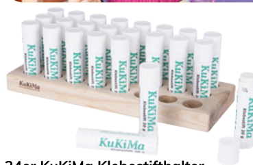
24er KuKiMa Klebestifthalter , gefüllt mit 24 Klebestiften à 20 g P321-1008294 28,60 € inkl. MwSt