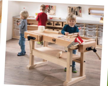
Werk- und Bastelräume fürs Leben lernen