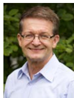
Hans-Peter Wimmer Mediaberatung